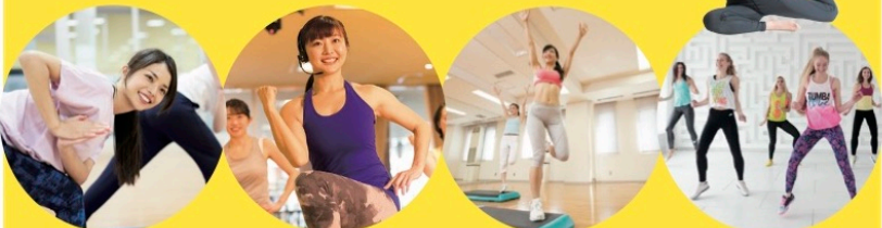
パワーYOGA エアロビクス ステップ ZUMBA

運動初心者が楽しめる多彩なプログラムをご用意しています。お好きなレッスンを自由にお楽しみ下さい。月会員様は全てのスタジオプログラムに無料で何度でもご参加頂けます。