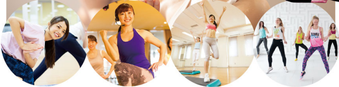
パワーYOGA エアロビクス ステップ ZUMBA

経験豊富な インストラクターが 効果的なスタジオレッスンで あなたをバックアップ!