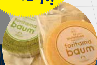
徳地とり魂の里 toritama baum 協賛: (株) 出雲ファーム